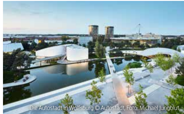
Die Autostadt in Wolfsburg

www.vechelde.de/freizeit/kultureinrichtungen/zeitraeume-bodenstedt