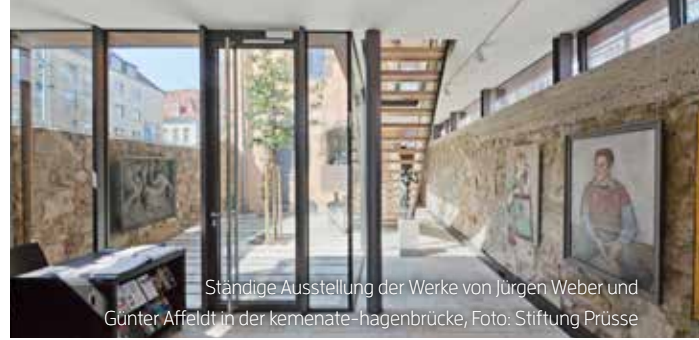
Ständige Ausstellung der Werke von Jürgen Weber und Günter Affeldt in der kemenate-hagenbrücke, Foto: Stiftung Prüsse

Hauptstraße 47, 31249 Hohenhameln www.kunsthof-mehrum.de