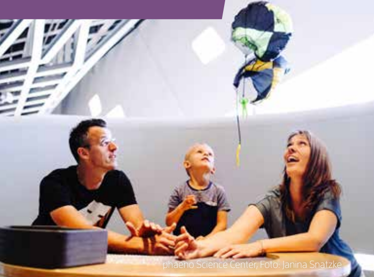
phaeno Science Center