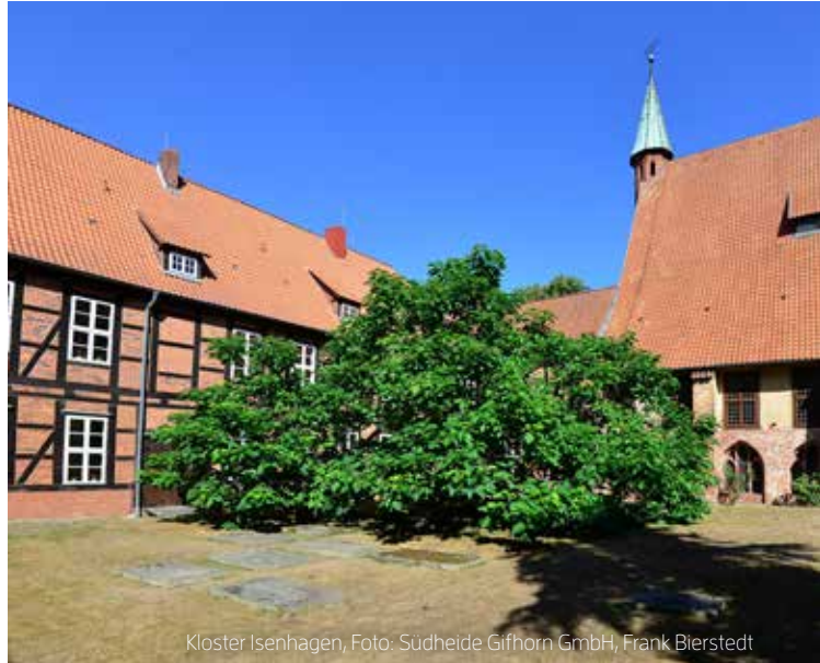
Kloster Isenhagen