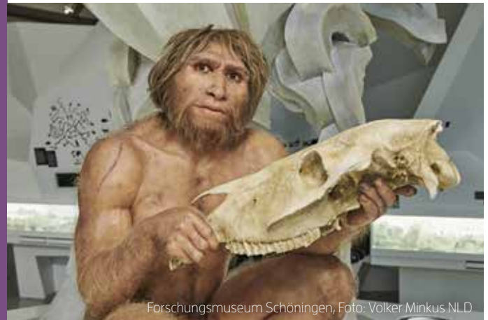
Forschungsmuseum Schöningen

Immer wieder werden versteinerte Urzeittiere oder Spuren des menschlichen Steinzeit-Lebens gefunden. In unterschiedlichen Museen der Region lassen sich die Funde bestaunen. Auch Archäologie-Neulinge können sich im Geopark selbst auf die Suche nach einem außergewöhnlichen Fund machen.