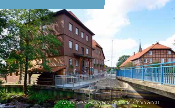
Wahrenholzer Mühle, Foto: Südheide Gifhorn GmbH

Der Verkehr, ob auf der Straße oder in der Luft, gehört zu den Hauptthemen der Region und findet sich auch in den zeitORTen wieder. Die Autostadt in Wolfsburg lädt auf eine Entdeckungstour zum Thema Mobilität ein. Innovation beruht auf Forschung und Wissenschaft. Im Science Center phaeno Wolfsburg erhalten Besucher:innen die Möglichkeit, selbst auf spektakuläre Art die Gesetze der Natur zu erforschen.