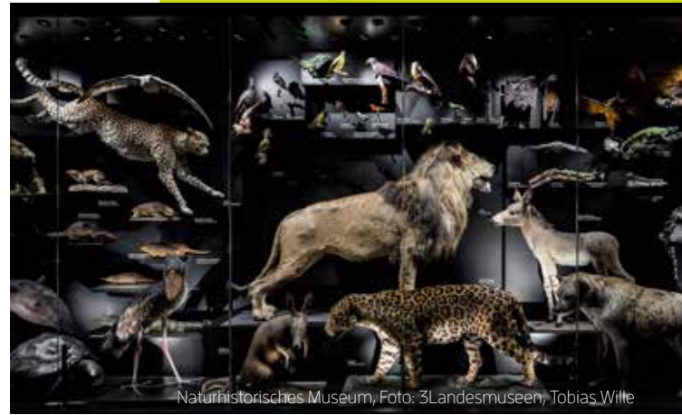
Naturhistorisches Museum