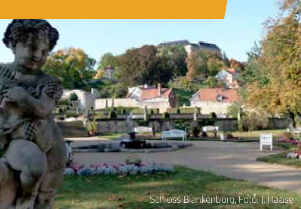
Schloss Blankenburg