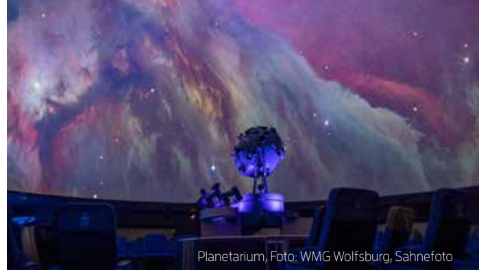
Planetarium, Foto: WMG Wolfsburg, Sahnfoto