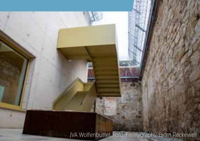
JVA Wolfenbüttel, Foto: Freelygraphy, Björn Reckewell