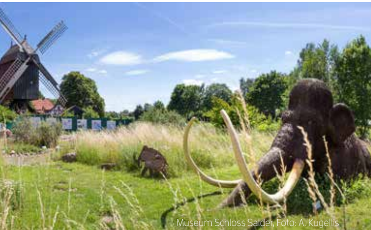
Museum Schloss Salder, Foto: A. Kugellis