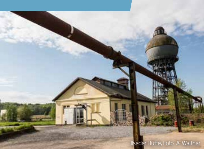
Ilseeder Hütte