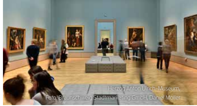
Herzog Anton Ulrich-Museum,