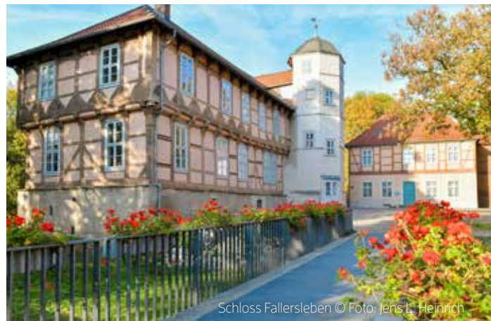
Schloss Fallersleben

Vom pferdegezogenen Gerät bis zur selbstfahrenden Erntemaschine werden Maschinen und Arbeitsabläufe verschiedener Epochen dargestellt. Aktionstage zum Mitmachen runden das Angebot ab. www.gut-steinhof.de