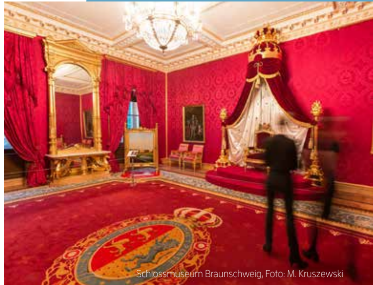
Schlossmuseum Braunschweig, Foto: M. Kruszewski