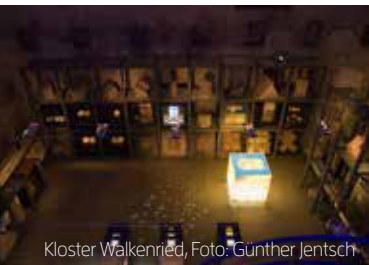
Kloster Walkenried, Foto: Günther Jentsch